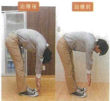
左が治療後の前屈写真。治療前と比べると違うのが一目瞭然!

「背骨の動きを正常に戻すためには、生活習慣を見直すことも非常に重要です」と脇元先生。